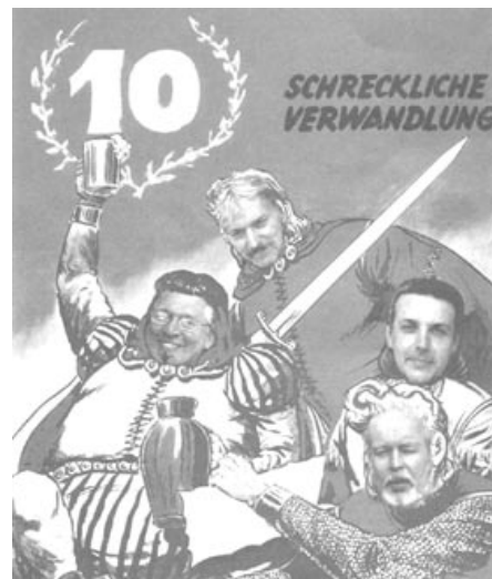
Das Kollektiv-Team nach dem Eintauchen in das Wäscher'sche Universum.

Also nichts wie hin, denn als ehemalige Schattner-Kunden sind die Knüppel Bros. durchaus in der Lage selbst dem verwöhntesten Sammler noch das eine oder andere Heftchen in 0 unter die Nase zu halten. Comic-Laden Kollektiv, Fruchttalée 130, 20259 Hamburg, tel 040-40 77 81, fax 040-490 83 63 oder www.comic-laden.de