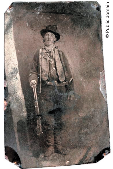
Die Ferrotypie im Original, also seitenverkehrt.

© der Abbildungen bei den Verlagen bzw. Zeichnern oder Fotografen. Der Szene WHatcher ist kostenlos und erscheint ausschliesslich digital im Internet. Alle Beiträge, wenn nicht anders gekennzeichnet, stammen aus der Szene WHatcher-Redaktion. Für unverlangt eingesandte Beiträge wird keine Haftung übernommen. Eine Verwertung der urheberrechtlich geschützten Beiträge und Abbildungen, insbesondere durch Vervielfältigung und/oder Vertreibung, ist ohne vorherige schriftliche Zustimmung des Herausgebers unzulässig und strafbar, soweit sich aus dem Urheberrecht nichts anderes ergibt. Die Meinung der Mitarbeiter gibt nicht unbedingt die des Herausgebers wieder.